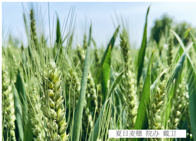
夏日麦穗 院办 戴卫