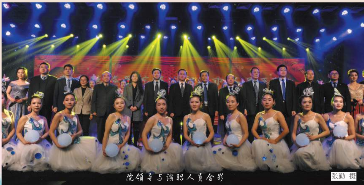
院领导与演职人员合影