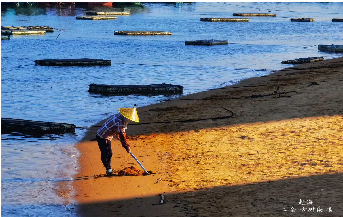
赶海 工会 方树侠 摄